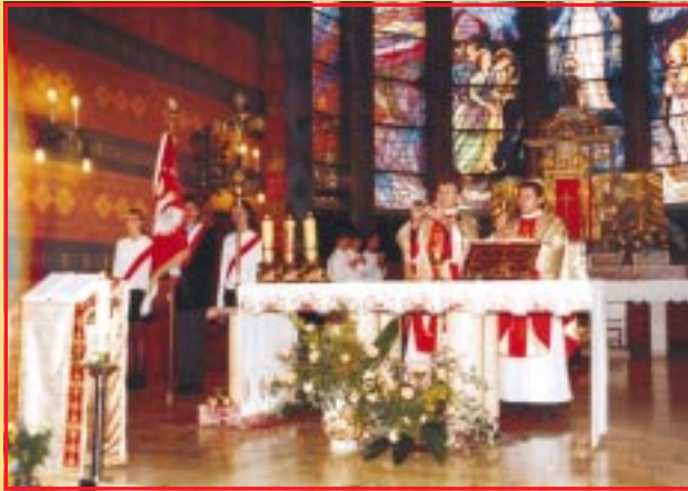
Poświęcenie sztandaru Gimnazjum Nr 16