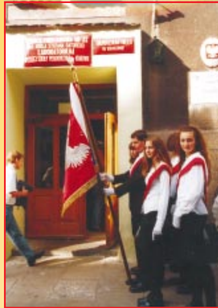
Wprowadzenie sztandaru do Szkoły