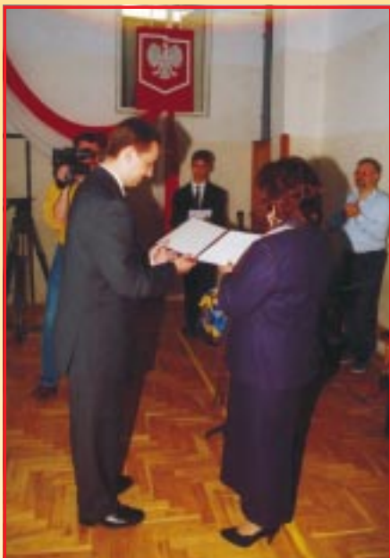
Akt nadania Gimnazjum imienia Króla Stefana Batorego