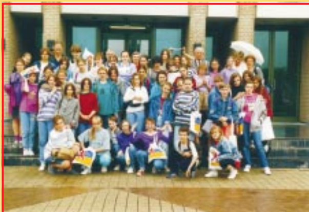
1993 – pierwsza wymiana młodzieży ze szkołą w Holandii

1992 – szkoła zakupuje pierwsze komputery,