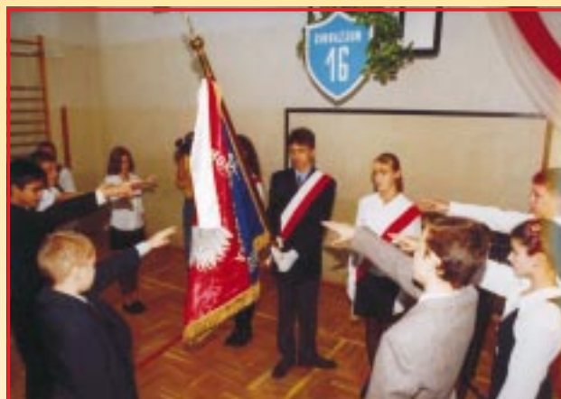
Ślubowanie uczniów klas pierwszych Gimnazjum