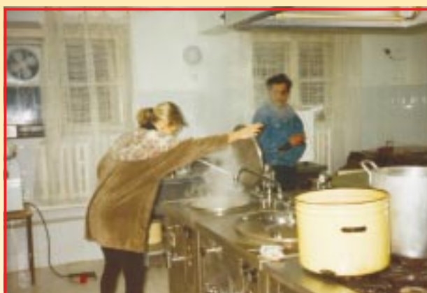
Modernizacja kuchni i stołówki

Dyrekcja rozpoczyna starania o wybudowanie drugiej sali gimnastycznej. Założony zostaje ogród szkolny. Szkoła przystępuje do międzynarodowego programu „TEMPUS”. Powstaje internetowa strona szkoły. Korzystamy z telefonicznego podłączenia do internetu.